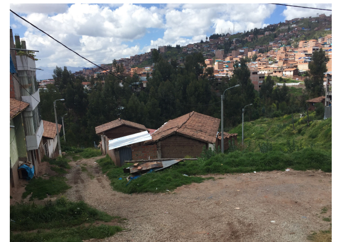
EDIFICACIONES DE LA MANZANA C' EMPLAZADAS EN ZONA DE PELIGRO ALTO POR DESLIZAMIENTO