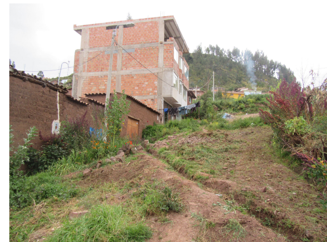
EDIFICACIONES DE LA MANZANA B' EMPLAZADAS EN ZONA DE PELIGRO ALTO POR DESLIZAMIENTO